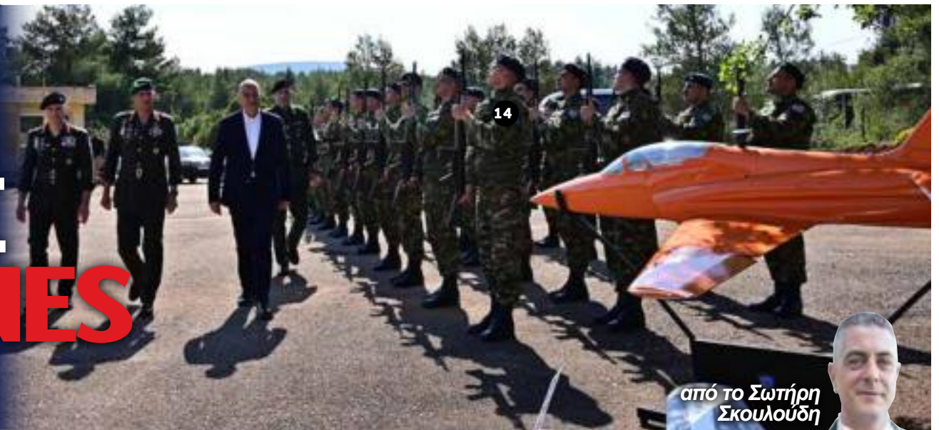
από το Σωτήρη Σκουλούδη

Τι δοκιμάζουν οι Ένοπλες Δυνάμεις και πώς αλλάζουν οι ισορροπίες στο Αιγαίο