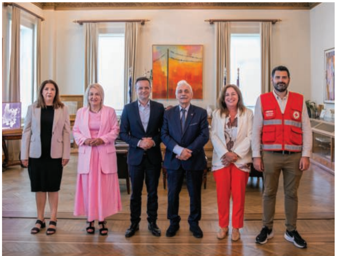
δ) την ανάπτυξη κοινών κοινωνικών, ανθρωπιστικών και εκπαιδευτικών δράσεων προς όφελος των πολιτών.